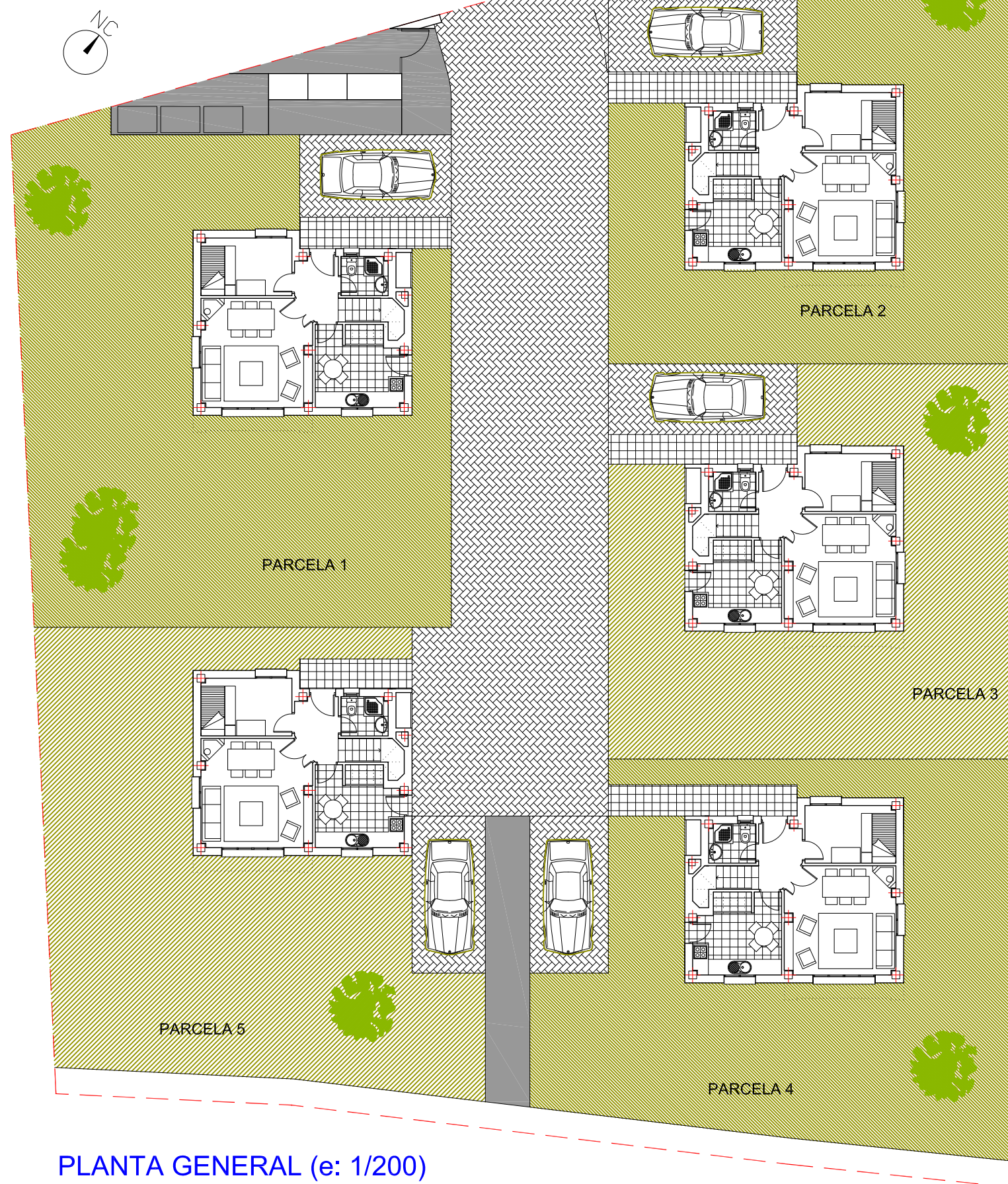
PLANTA GENERAL (e: 1/200)

SUPERFICIE DE PARCELA PRIVATIVA: 310,00 m 2